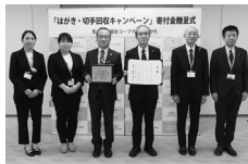
2024年度寄付金贈呈式の様子

コープデリにいがたは地域とのつながりを大切に、誰もがくらしやすい社会づくりに貢献するために、行政や他団体、NPO法人等と連携して様々な取り組みを進めています。また、社会福祉法人新潟県共同募金会は、地域福祉の推進のための赤い羽根共同募金をはじめとして、様々な地域の課題解決に取り組む民間団体を応援しています。そこで、新潟県共同募金会を通じて、新潟県内の子ども・子育て支援に取り組んでいる団体への助成金として寄付金を活用します。