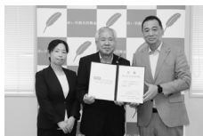
2024年度寄付金贈呈式の様子

皆さまから寄せられたはがき・切手などの換金で得られる 資金を群馬県内の「子ども・子育て」支援を目的として 群馬県共同募金会（赤い羽根共同募金）に寄付します。