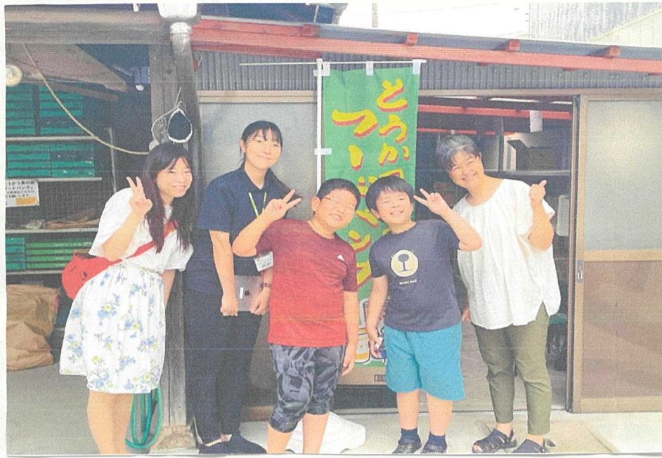
とうかつ草の根フードバンクに行ってきました。