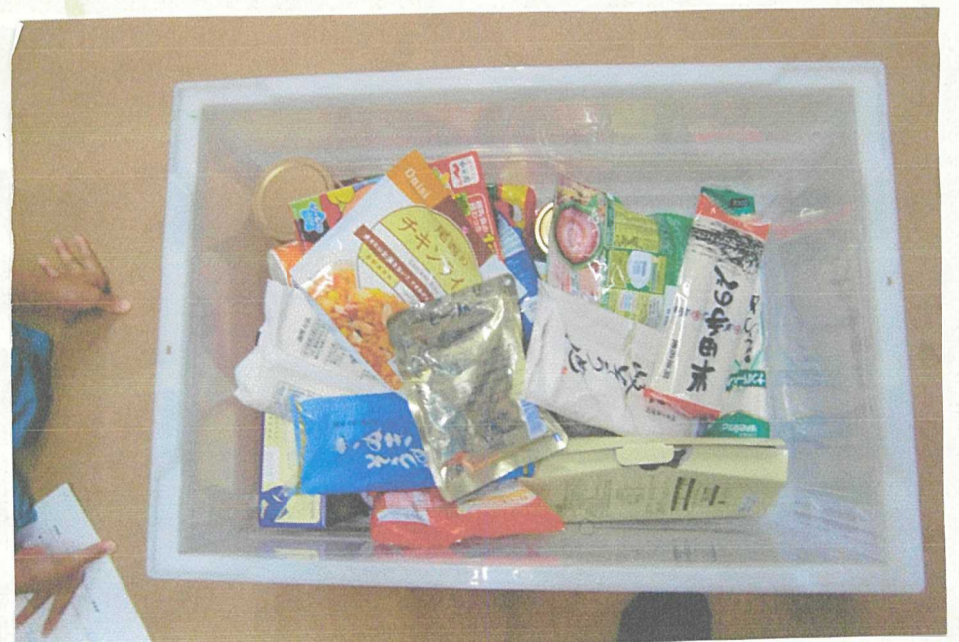
いろいろな食料があります。