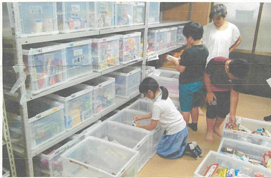
しょうみきかん別に分けられています。