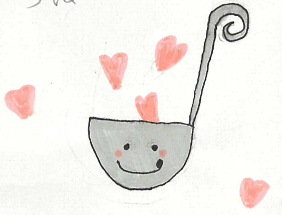
↑ フードバンクちはのイメージキャラクター 「おたまちゃん」

フードバンクとは、まだ食べられるのに形がきれいで、はなからたりしてスーパーなどに出せない食料を企業から寄付してもらったり、買ったのに食べない物を家庭から寄付してもらう必要としている施設や団体に無償で提供する活動、団体のこと。