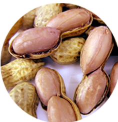
らっかせい 落花生