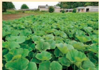
大きな葉の下で、かぼちゃの実がすくすくと育ちます

かぼちゃの実がげんこつ大くらいに成長すると、病気や日焼けから守る対策をします。皮が薄くとてもデリケートなので、太陽の光で日焼けしないように葉を大きく育て、実を守ります。まるで自分の子どものように収穫までは目が離せません。手間はかかりますが、かけた分おいしく育ってくれるのでやりがいがあります。